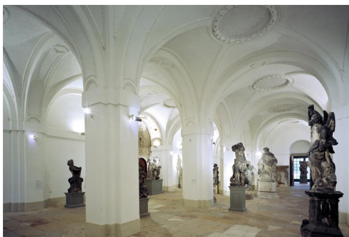
Palais im Großen Garten - Mittelsaal