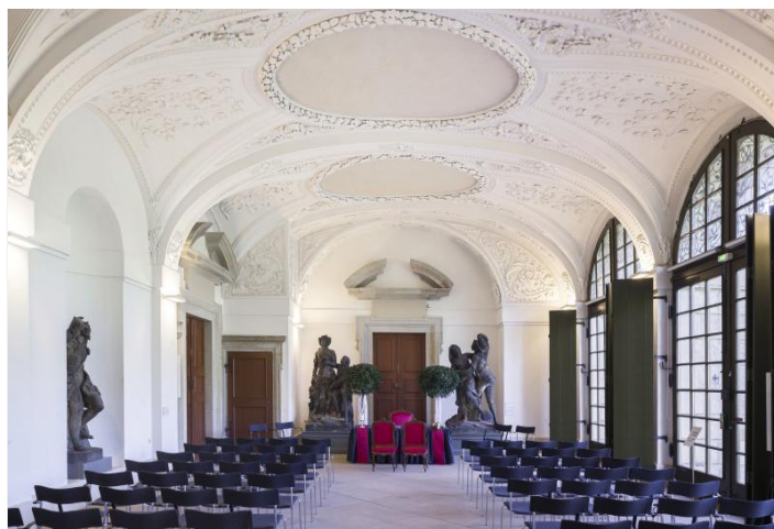
Trauungen im Palais