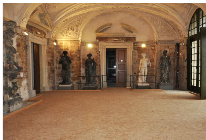
Palais - Langersaal Nord