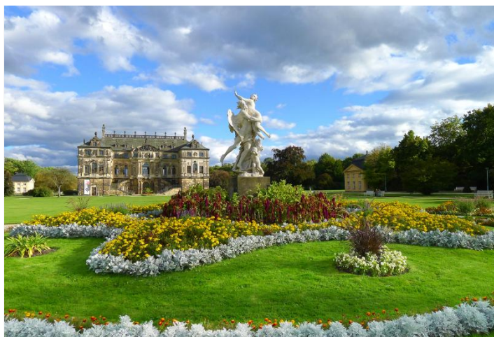
Das Palais im Großen Garten