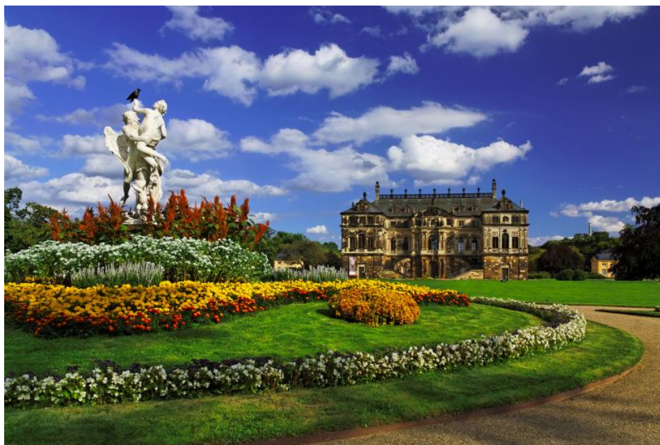
Palais im Großen Garten

E-Mail: jana.kursave@schloesserland-sachsen.de