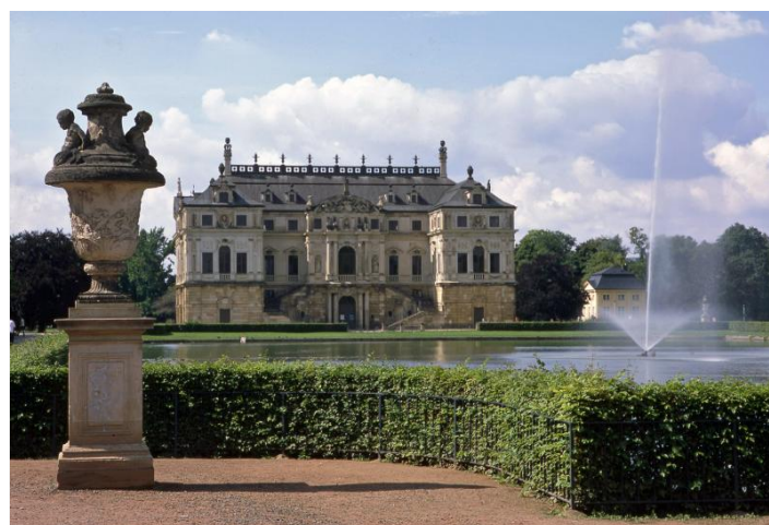
Schmuckplatz mit Palais im Großen Garten